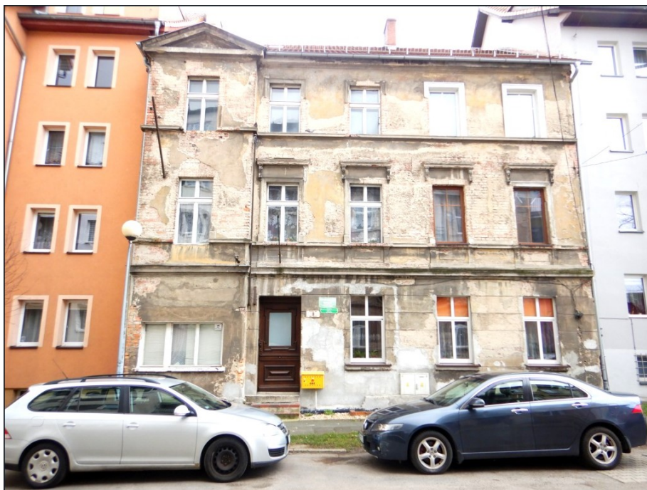
Ogólny widok budynku

na sprzedaż lokalu mieszkalnego Nr 6 znajdującego się w budynku położonym w Lubaniu przy ul. Hutniczej 8 wraz z udziałem we współwłasności nieruchomości gruntowej (działka nr 5, AM 10, Obręb III o powierzchni 148 m 2 , JG1L/00016295/9)